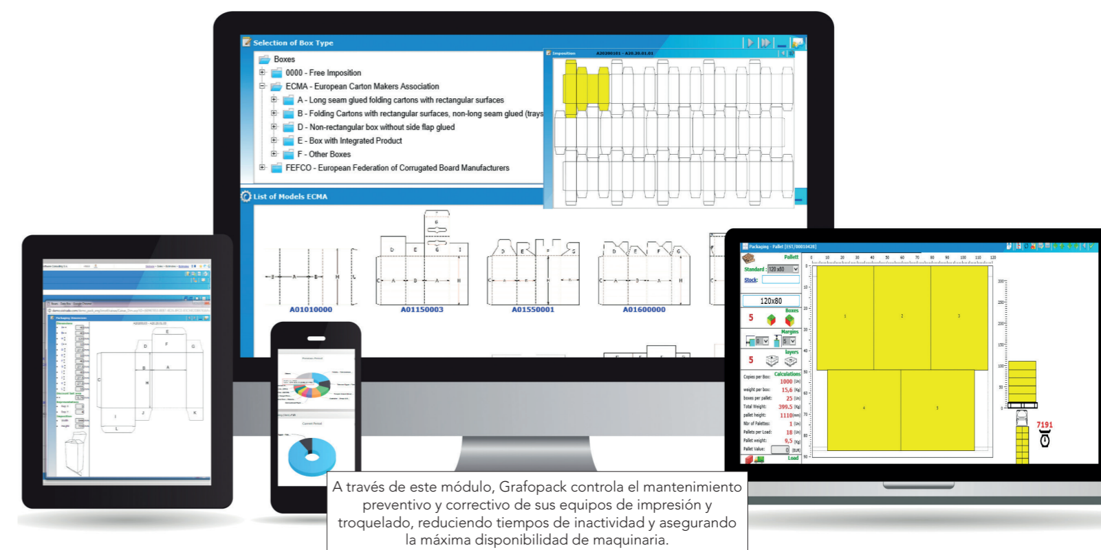
A través de este módulo, Grafopack controla el mantenimiento preventivo y correctivo de sus equipos de impresión y troquelado, reduciendo tiempos de inactividad y asegurando la máxima disponibilidad de maquinaria.